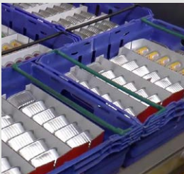
SRS kasser (genanvendelige plastikkasser)