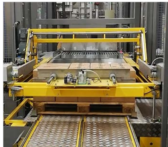
Se MK3 pallelasteren i brug her