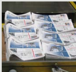
Aviser og blade