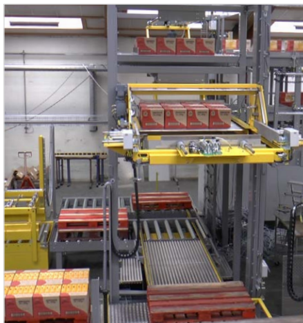
Palletering af kasser