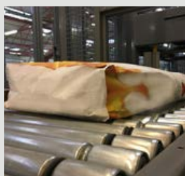
Poser og sække