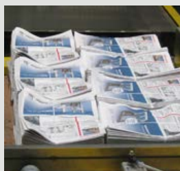
Aviser og blade