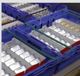
SRS kasser (genanvendelige plastikasser)